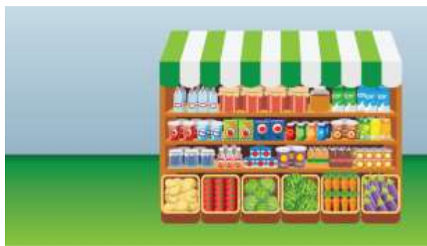
Esempi di situazioni presentate nel gioco