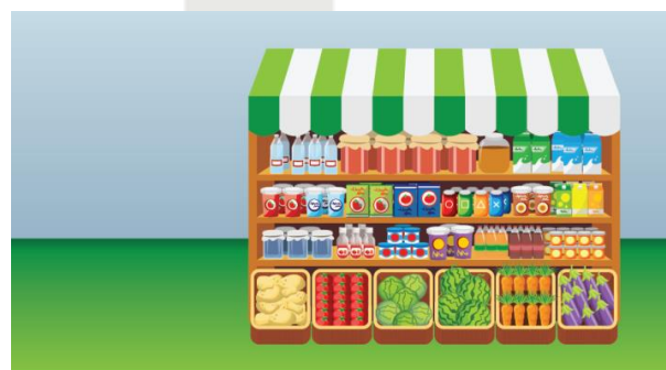
1. Εικόνες από το περιβάλλον του παιχνιδιού